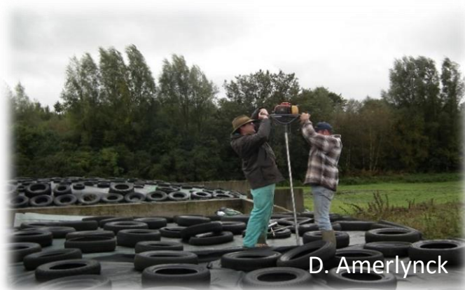
Photo 2. Echantillonnage des silos