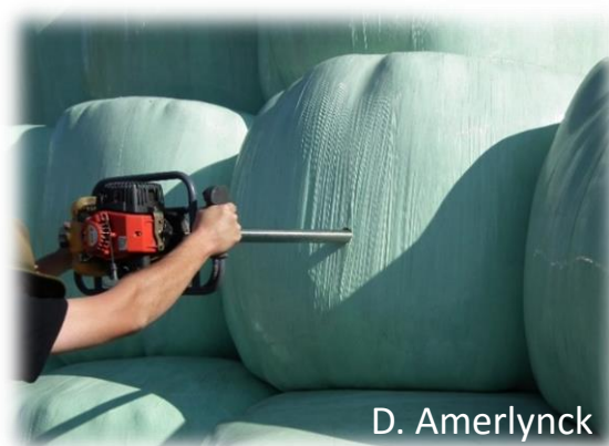
Photo 1. Echantillonnage de balles rondes

Une sonde bien aiguisée est nécessaire pour l'échantillonnage des balles rondes et des balles carrées. Les parties non consommables par les animaux (moisies...) ne sont pas échantillonnées. Pour réaliser un échantillon représentatif, on recommande de prélever au moins dans 10 balles. En pratique, les prélèvements ont rarement lieu dans plus de deux balles.