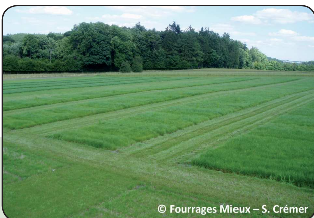
▼ Figure 1. Vue d'une parcelle de variétés de ray-grass anglais testées en régime de fauche

Les listes des pages 2 et 3 ne sont pas exhaustives car toutes les variétés disponibles dans le commerce n'ont pas été testées dans nos essais. Sont reprises dans les tableaux 1 et 2 les variétés qui se sont révélées les meilleures dans les essais et qui sont commercialisées en 2016.